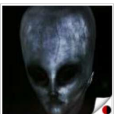
13 таємниць NASA, які вкрали хакери